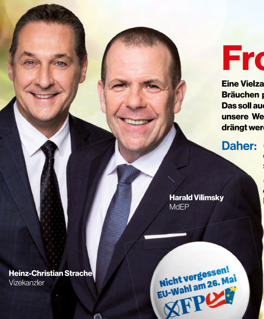
Harald Vilimsky MdEP

Auf Grund des erfreulichen Anstiegs an Geburten und des nicht weniger erfreulichen Zuzugs von Bürgerinnen und Bürgern mit Kindern aus den Nachbargemeinden ist ein Ausbau der Kinderbetreuungseinrichtungen dringend notwendig, besser gesagt längst überfällig (siehe unsere Aussendung im Sommer 2018). Trotz dieser steigenden Zahlen ist es für Jungfamilien entscheidend und wichtig, welche Infrastruktur in Bezug auf Kinderbetreuung und Ausbildung sie in Altheim vorfinden. Es darf keinesfalls vorkommen, dass in Altheim lebende Kinder keinen Platz im Kindergarten, in der Krabbelstube oder im Schülerhort vorfinden. Eine sofortige Aufnahme von Gesprächen mit dem Land Oberösterreich sowie einer ehest möglichen Umsetzung seitens der Stadtgemeinde Altheim wird von uns vehement eingefordert!!!